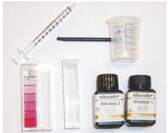
Fig. 2 - Kit test con comparatore visuale

Queste misure devono essere eseguite a una lunghezza d'onda fissa, diversa a seconda della sostanza da determinare. Alcuni fotometri sono predisposti per lavorare a una lunghezza d'onda singola, oppure consentono la scelta di pochi valori di lunghezza d'onda. Questi strumenti, analogamente ai riflettometri, permettono di determinare la concentrazione di una sola o di poche sostanze e for-