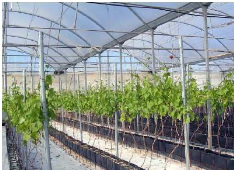
Figura 3. Vite fuori suolo sotto serra moderna- impianto "a ciclo chiuso"

La gestione della distribuzione idrica e minerale della pianta ed il controllo costante della conducibilità elettrica (EC) e del pH della soluzione nutritiva (Di Lorenzo et al., l.c.) avviene attraverso una centralina computerizzata di fertirrigazione.