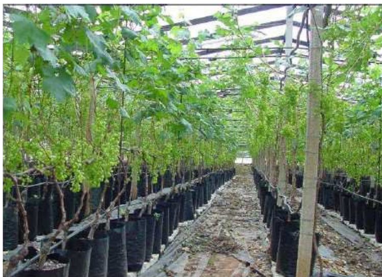
Figura 2. Vite fuori suolo sotto serra tradizionale "a capannina"

Gli apprestamenti serricoli dove sono stati realizzati i primi impianti in fuori suolo per la vite sono quelli tradizionali (serra fredda a "capannina") con altezza alla gronda di 2,15 mt e al colmo di 2,65 mt, e copertura con film plastico in polietilene additivato con EVA e cariche minerali. Tali impianti non prevedevano il riutilizzo della soluzione nutritiva (impianti a ciclo aperto) distribuita attraverso un impianto di microportata con gocciolatori autocompensanti; in questo caso i contenitori dove venivano coltivate le viti, erano isolati dal terreno per facilitare lo sgrondo dell'acqua d'irrigazione (Fig. 2); gli impianti più recenti, realizzati nell'ambito della sperimentazione sotto serra-tunnel prevedono, inoltre, un recupero totale dell'acqua d'irrigazione, sono pertanto a ciclo chiuso (Fig. 3).