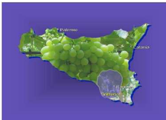
Figura 1. Area di sperimentazione dell'uva da tavola protetta in Sicilia

La ricerca è stata condotta in aziende specializzate nella produzione di uva da tavola in serra ricadenti in agro di Vittoria (RG) – quota 30 mt s.l.m, Lat. 36° N 58' Long. 14° E 32' – Sicilia (Fig. 1).