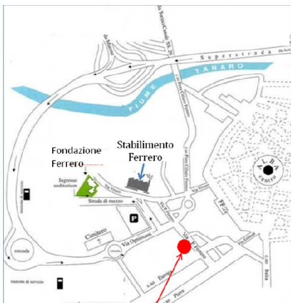
Centro Ricerche Soremartec (ex Filanda) Via P. Ferrero 19, Alba